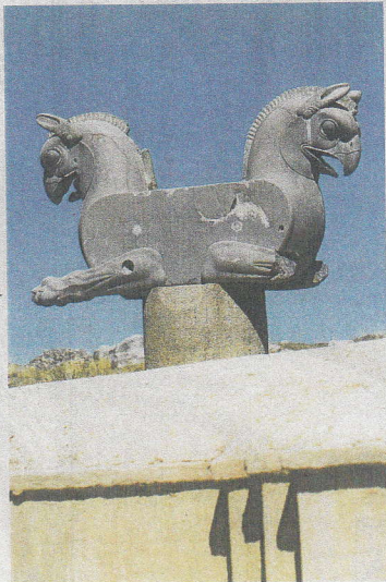
イランの古代遺跡にみられる伝説上の動物「グリフィン」の彫刻。なんとプロトケラトプスに似ていませんか？(AFP時事)